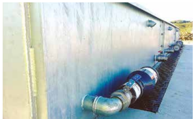
Filtraggio e scarico in modo continuo delle acque piovane (impianti esterni)