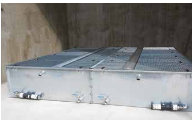
Ritenzione totale del dielettrico