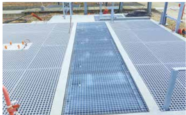
Impalcatura di grigliato