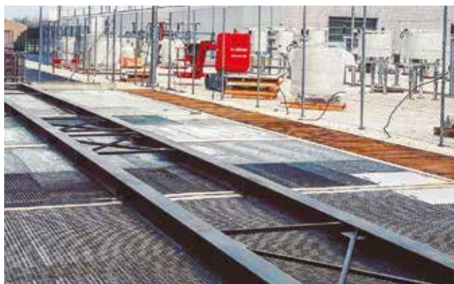
Travi di sostegno del trasformatore (se necessario)