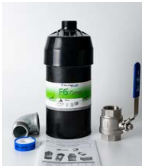
Portata di 6 litri al minuto in flusso a gravità