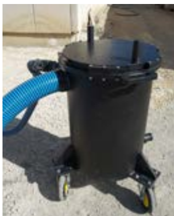
Portata di 50 litri al minuto pompato