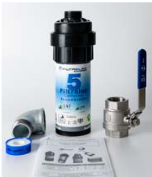
Portata di 5 litri al minuto in flusso a gravità

FILTRELEC® è un'alternativa tecnica ed economica ai decantatori e ai separatori classici.