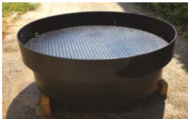
Portata di 1500 litri al minuto in flusso a gravità